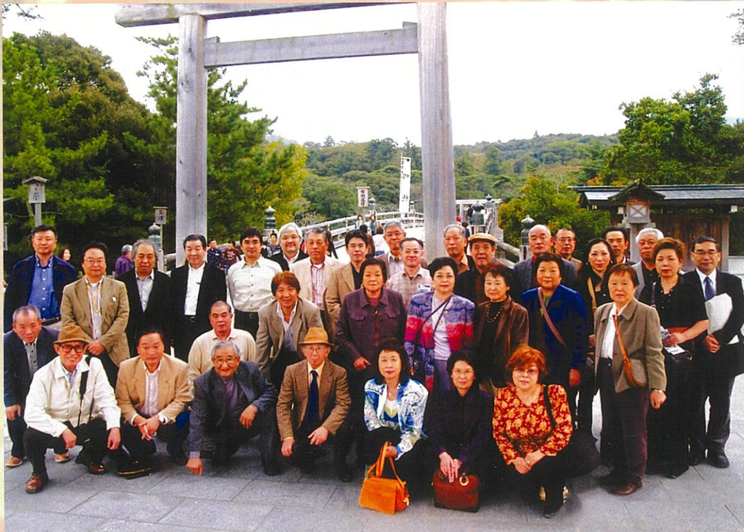
「伊勢神宮内宮宇治橋鳥居前にて」 平成18年度視察・親睦旅行