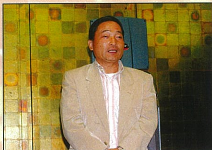
懇親会でごあいさつ