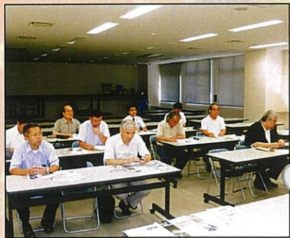
テクノWING建設経緯について説明を受ける

当組合のような民間による工場アパートの建設が可能かどうかの研究を進めていきたいと考えています。