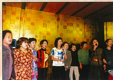
女性全員による熱唱