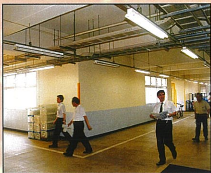
工場棟内施設の見学