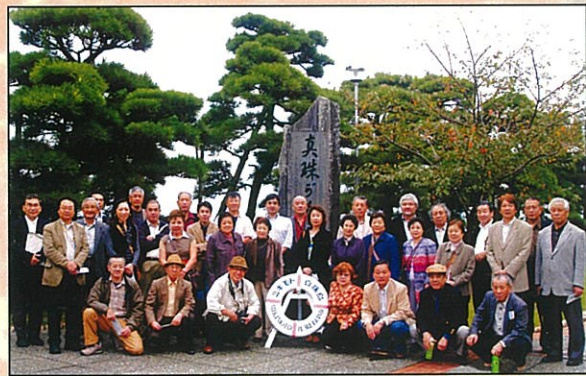
ミキモト真珠島にて