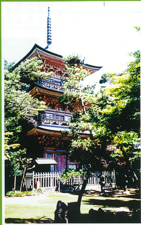
源範頼ゆかりの寺、岩殿山安楽寺の三重の塔（埼玉県指定の文化財）