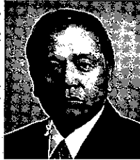
長 己 新年あけ ましておめ でとうござ います。