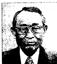
所製木型大塚 新年あけましておめでとうございます。新組合の皆様もお健やかに初春をお迎えることお慶び申し上げます。

昨今の産業界は不透明感が続き、企業には増々厳しい時代になりました。社会情勢も悪くなり生活面でも緊張の連続で中々心のゆとりがもてない毎日は、大正、昭和、平成の