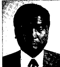
長明 新年あけましておめでとうございます。皆様方にはお元気で新春を迎えられたことと存じます。

青年研究会も、早、十二年目を迎え、これもひとえに、親組合、先輩諸氏、そして事務局の方々のお力添のおかげと感謝申し上げます。さて、昨年来、景気は緩慢ながら回復過程にあるとされておりますが、