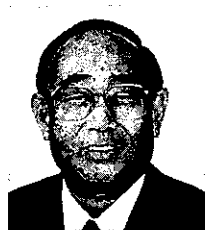
長 治 新年あけ ましておめ でとうござ います。

工業団地協同組合員の皆様には輝か しい新年をお迎えのことと心からお 慶び申し上げます。